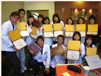
●海外學習—美國南加州大學完成課程