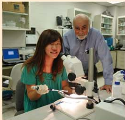
●海外學習—美國德克薩斯大學休士頓醫學院中心見習