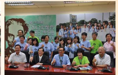
●溫尋繹香典輿—探索史懷哲

中國醫藥大學再次榮獲第三期教育部獎勵大學教學卓越計畫，於 101 年 8 月本校躍登世界學術排名頂尖五百大之列並躋身世界醫科領域兩百強，秉持「邁向國際一流大學」目標，連續獲得教育部肯定，核定執行期程為四年，自 102 至 105 年期間，每年可獲得 9,000 萬元補助經費，四年共獲 3 億 6,000 萬元補助，這是全校師生攜手共同努力的成果，在追求卓越的道路上，終能綠樹成蔭，短中長程目標一個接一個的達成，漸進奠定國際一流大學的地位。