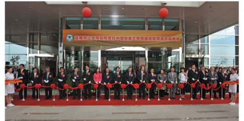
●安南醫院開幕剪綵

安南醫院的儀器設備都是第一流的，如電腦斷層是 128 切，磁振造影是最新的全身包圍線圈的 1.5T，而醫護技術人員更是訓練有素，學有專精的高水準專才，必定能提供大臺南地區民眾最好的醫療服務。