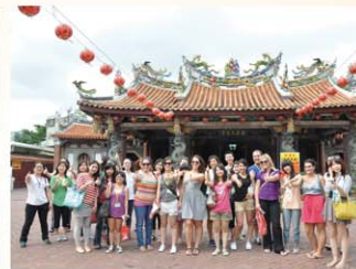
●國際交換生計畫(ISEP)—跨國混班教育模式