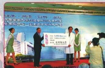
美商永生捐款予本校一仟萬元整 投入臍帶血幹細胞臨床研究