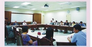
校友們以及各系所主管熱烈討論