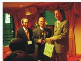
NATMA會長(左)與副會長(中)贈送禮品與紀念獎牌予蔡董事長紀念