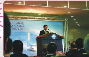
中央研究院翁啟惠院長致賀詞