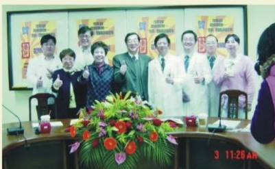
校長、曾蔡董事長、院長、副院長及各級主管於慶祝醫院升級後合照

中國醫藥大學北港附設醫院成立二十餘年以來，致力於提供完善的醫療服務；發揮大學醫院教學、研究功能；以及展現中醫藥養生保健的特色。近年來