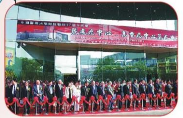
開幕典禮，剪綵儀式