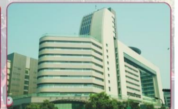
五權院區(前棟是急重症中心大樓，後棟是癌症中心大樓)