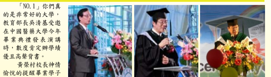
吳清基部長見證中國醫藥大學的卓越辦學成效 黃榮村校長祝福畢業生迎向璀璨人生 蔡長海董事長鼓勵畢業生學子勇於創新去圓夢

「NO.1」你們真的是非常好的大學，教育部長吳清基受邀在中國醫藥大學今年畢業典禮發表演講時，數度肯定辦學績優且高聲背書。