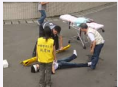
緊急救護受傷同學送醫