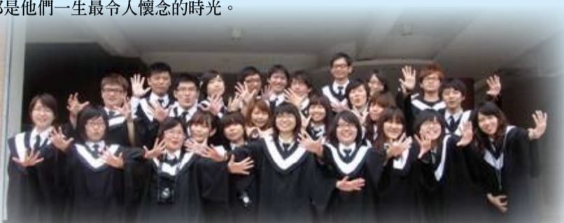
醫系回到北港分部拍畢業照