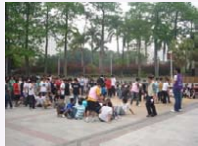
住校同學疏散到中山堂廣場避難