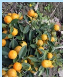
98學年度種植的「金桔」已結實累累

下午我要離開時，真的被一幕景象感動了。五月底正值學生拍畢業照的時間，多數在台中校園拍學士照，那天我看到二群不同系的同學，自己包車特地回到北港校區拍畢業照，要填補這段令他們難以忘懷的記憶。他們說，將來結婚時，也要來這裡拍婚紗照，因爲在這裡的一年，都是他們一生最令人懷念的時光。