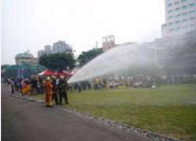
身歷其境的消防滅火演練