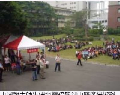
中國醫藥大學師生遇地震疏散到中庭廣場避難