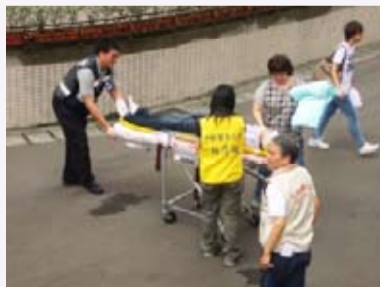
救護受傷同學送醫