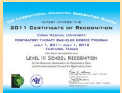
IERS Level III證書

呼吸治療專業在美國自1943年開始萌芽，至今已發展超過60多年，是世界最先有呼吸治療師專業的國家。美國呼吸照護學會為推動國際呼吸治療專業發展，除了在1991年成立世界呼吸照護聯盟，並設立國際訪問學者活動，每年提供4至8名的名額供世界其他國家對呼吸治療專業有興趣的人申請，經評審錄取者由美國呼吸照護學會提供為期三週的活動，前兩週拜訪兩個美國城市，由專人帶領參觀學校教育、醫院急重症及居家長期照護，最後一週參加美國呼吸照護學會舉辦為期四天的年度大會(註：本系有施純明副教授、朱家成講師及劉金蓉講師分別獲得國際訪問學者殊榮)。2004年開始由美國呼吸照護學會結合世界呼吸照護聯盟著手規劃如何幫助世界其他國家提供優質呼吸治療課程或提供訊息讓有意投入呼吸治療專業者有參予或諮詢管道，因此規劃國際教育認證系統(International Education Recognition System, IERS)，分為三個層次，Level I是針對單次研討會的認證，Level II是針對中短期訓練課程的認證，而Level III是針對學校課程的認證。本系自95學年度設立以來，每年都與美國呼吸照護學會及世界呼吸照護聯盟成員有密切的交流，他們對於本系課程設計及師資皆有詳細的認識，並與本系學生面對面的溝通交談。本系在98學年度並設立國際呼吸治療專業學習課程，經由教育部教學卓越計畫的補助，選送學生至美國參觀呼吸治療師在學校訓練及職場就業的情形，此舉也受到美國呼吸照護學會國際事務委員會的高度重視，並提交世界呼吸照護聯盟報告。在此背景下，本系99學年度下學期向美國呼吸照護學會及世界呼吸照護聯盟提出了IERS的認證，很快地就獲得認可，頒發由美國呼吸照護學會美國呼吸照護學會理事長 Karan Stewart 及世界呼吸照護聯盟主席 Jerome Sullivan所聯合簽名的證書，是台灣第一家獲得此一證書的呼吸治療學系。