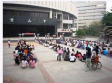
校園防災疏散演練