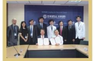
本校與南韓延世大學續簽 合作備忘錄並舉辦雙邊研討會

李校長殷切期盼，系所暨行政主管是學校的骨幹非常重要，這個meeting就是要讓大家都想想看，大家要有企圖心開創新局，敞開胸懷帶領同仁攜手共好，你驕傲、他驕傲，都是我們的驕傲。