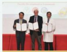
本校暨附設醫院與美國ACGME簽訂合作備忘錄