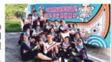
● 蘭嶼巡迴醫療服務

本校暑期「鐵馬義診暨衛教宣導青年軍」由高教深耕執行處 (USR計畫) 與體育室共同策劃，結合來自醫學系、中醫系、後中醫系、藥學系、護理系以及公衛系的17位大學生與7位醫師，以單車做為交通工具，成為服務不設限的象徵，於7月8日上午自台中校本部出發，展開為期兩周的環島壯遊，並深入了解偏鄉醫療現況。