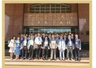
韓國學校法人平成醫療學園 蒞校進行中醫參訪