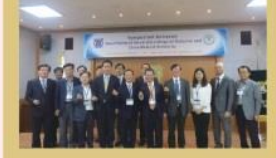
本校與首爾國立大學 舉辦第二屆雙邊研討會合影

本校代表團並與首爾國立大學醫學院教授代表舉辦第二屆首爾國立大學暨中醫大雙邊研討會，探討老化、癌症、中醫藥、神經科學及幹細胞的研究新知，雙邊研討會後雙方討論將針對老化、癌症、中醫藥、神經科學、幹細胞、放射腫瘤及精準醫學等方面進行深入合作。