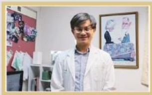
蘇冠賢醫師團隊研究結果豐碩

對於憂鬱症患者的療養照顧，現任台灣營養及精神醫學研究學會(TSNPR)理事長蘇冠賢教授無旁貸的說，醫學界除了持續結合分子生物學及基因遺傳學探究憂鬱症病因外，將爭取在醫院建構創新整合治療的精神健康特色中心，期望以優質醫療環境造福身心患者。