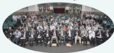
國際醫學教育研討會大合照

為促進醫學教育訓練品質，本校暨附設醫院與美國研究生醫學教育認證委員會(ACGME)簽訂合作備忘錄，獲得授權本校暨附設醫院可以辦理ACGME教師培育之課程，並可招收台灣與鄰近國家的醫師教育相關負責人為學員，將有助於提升本校及附設醫院在國內外醫學教育之影響力。